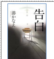
2009年 大賞 告白