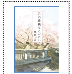
2016年 2位 君の瞳をたたいて