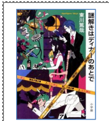
2011年 大賞 謎解きはディナーのあとで