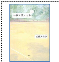
2007年 大賞 一瞬の風になれ