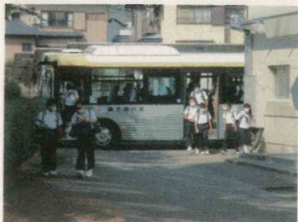
スクールバスで登校

また、昨年度は、生徒一人一人の負担を軽減するために、生徒会本部が中心となって、生徒会活動の見直しを行いました。活動数や活動内容、取組期間の短縮など、大きな見直しを行った結果、生徒は活動目標を明確に捉えることができるようになり、限られた取組時間の中で質の向上に重点をおいて頑張れるようになりました。生徒は、取り組みやすくなったことで、短期間の取組でも効率よく充実した活動ができると感じたようです。