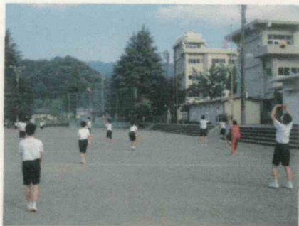
第1ステージ バレーボール部