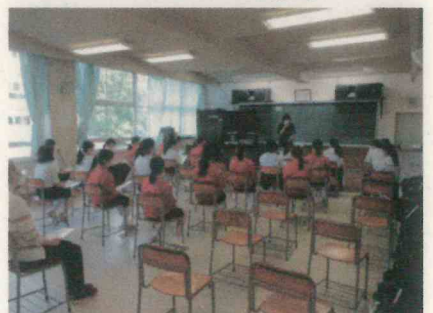
吹奏楽部の部集会