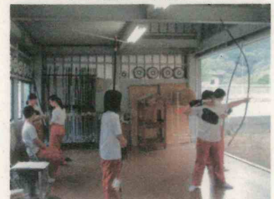
弓道部（本校弓道場）

1年生の中には、すでに入部を決めていた生徒も多く、早速入部届を出して練習に参加している生徒もいました。1年生が入部し、先輩たちもとてもうれしそうでした。