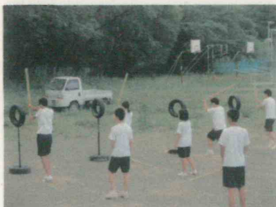
部活動に1年生参加 剣道部