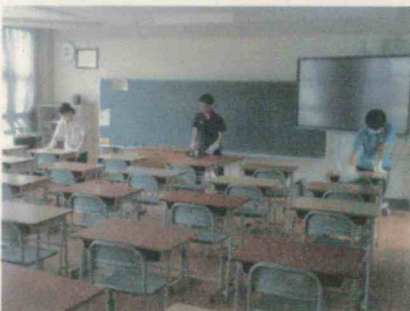
生徒下校後の消毒作業 机の消毒