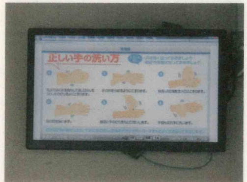
ディスプレイによる注意喚起

これからも、生徒や教職員、そのご家族から感染者が一人も出ないよう「新しい生活様式」を徹底していきたいと思いますので、よろしくお願いいたします。