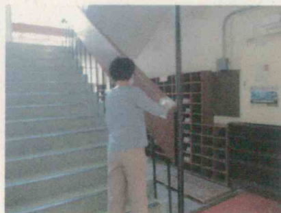
階段手すりの消毒