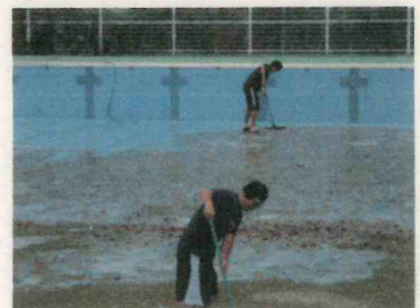
プール授業はありませんが、 プール清掃をする体育教師

通常登校が再開してからは、授業の遅れを取り戻すために、毎日が授業中心の日々になっています。そんな中、生徒たちは愚痴もこぼさず、熱心に授業に取り組んでいます。頑張っている生徒たちへのプレゼントとして、全校で学級レクを実施することにしました。学級役員を中心に、みんなで楽しめるような学級レクを計画してほしいと思います。