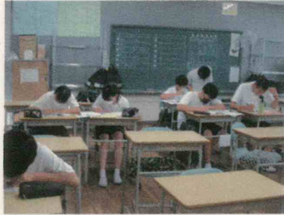
放課後の2年学習会