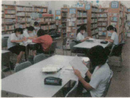
放課後の図書室でテスト勉強