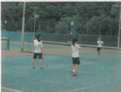
ソフトテニス部（市営コート場）