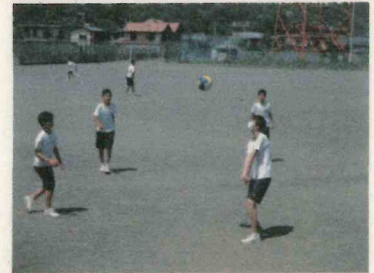
昼休みのグラウンド開放

本校では、昼休みにグラウンドを開放して、生徒たちが自由に体を動かすことを奨励しています。生徒にケガや事故が起こらないよう安全面を配慮し、職員が必ず付いて見守っています。生徒たちは、友だちと一緒にバレーボールやドッチボール、キャッチボールなどで楽しく体を動かしています。友だちと一緒に楽しく体を動かすことは、ストレス発散にもなり、学習への集中力にも効果的だと思います。