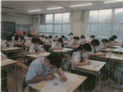
1年期末テストの様子