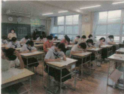
2年期末テストの様子