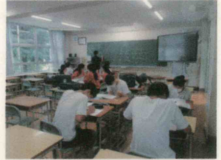
放課後の3年学習会