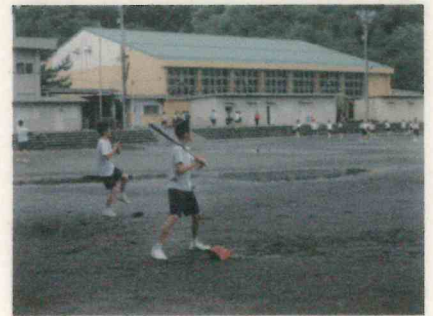
野球部（グラウンド）