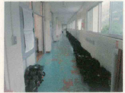
期末テスト日 1年の廊下

7月6日に期末テストを実施しました。テスト期間（7/1～7/5）には、放課後の学習会に多くの生徒が参加して、先生たちの指導の下、テスト勉強に励んでいました。長い臨時休業によって、多くの生徒たちが学習に不安を感じていたと思います。放課後学習会は、生徒の不安解消に大いに役立ったと感じています。特に、初めて定期テストを受ける1年生にとっては、友だちや先生と一緒にテスト勉強できたことは気持ちの支えになったと思います。