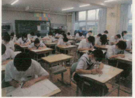
3年期末テストの様子