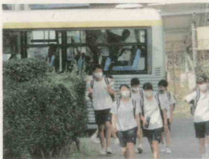
(2学期登校の様子) スクールバス