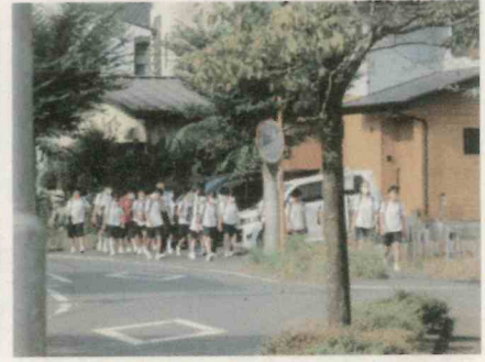
電車通学の生徒たち(赤坂駅から)

9月5日(土)には、 せのうみさい 石花海祭があります。今年の石花海祭は、すでにご連絡したとおり、新型コロナウイルス感染拡大防止を徹底した「新しいかたちの石花海祭」になります。