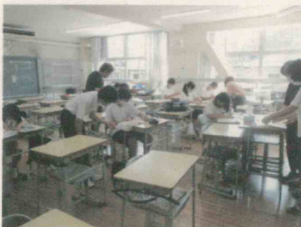
(フォローアップ教室) 3年の学習会