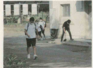
玄関掃除・あいさつ声かけ

19日間の短い夏休みがあつという間に終わり、8月20日から2学期がスタートしました。2学期も継続して、「3つの密を避ける」「マスクの着用」「手洗いや消毒」など「新しい生活様式」を全校で徹底しながら、可能な限り、通常の授業や部活動、各種行事等の教育活動を一步一步進めていきたいと考えています。また、連日の猛暑で熱中症が非常に心配されますが、熱中症対策として、夏用体育着での生活や水筒持参、エアコン