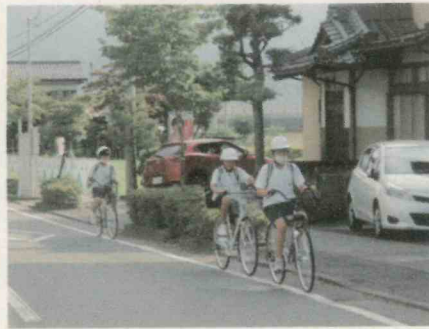
自転車通学の生徒たち