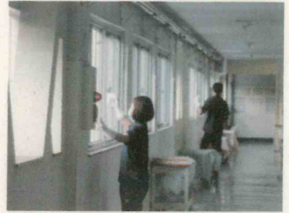
放課後の消毒作業

もしも、本校から、今後、感染者や濃厚接触者が出たとしても、本校では全校生徒、及び全教職員、また、その家族の協力を得て、大切な一人一人の人権を守っていきたいと考えています。保護者や地域の皆様には、学校の方針をご理解いただき、差別やいじめが起こらない学校づくりにご協力をよろしくお願いいたします。