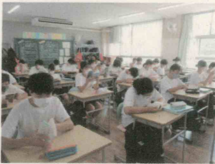
(2学期の様子) 1年朝読書