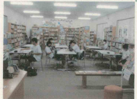
夏休みの図書館で自主学習 (8/7 撮影)