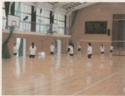
2年体育授業(距離をとって)