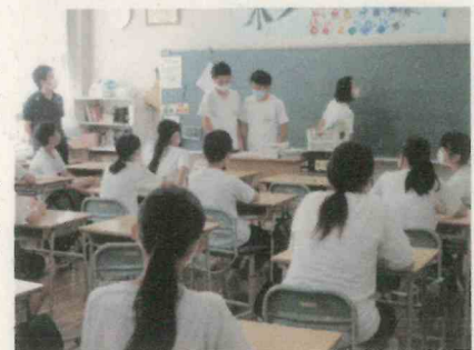
石花海祭の学級会

第1回実行委員会と放送による決起集会が開かれ、生徒たちの気持ちも高まってきました。8月31日～9月4日の5日間が集中取り組み期間になります。保護者の皆様、お子さんへの励ましや応援をよろしくお願ひいたします。