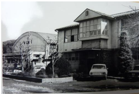
職員室のある棟と昭和38年落成の体育館