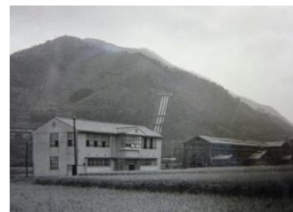
建築中の校舎（田んぼの中に）