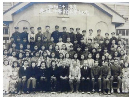
昭和22年度 第一期卒業生