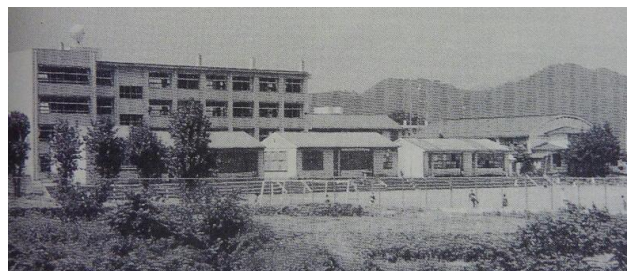
第一期工事新校舎（後方） 昭和52年8月