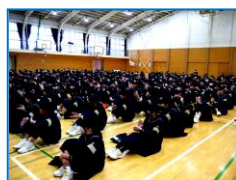
生徒会オリエンテーション