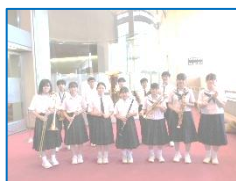
<県吹奏楽コンクール>