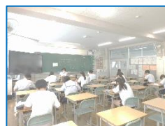
<フォローアップ学習会>