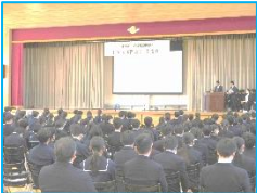
ISS 国際認 本審査

様々な話題を本校ホームページ（ニュース）にも掲載してありますので、是非ご覧ください。