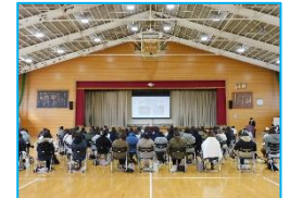
生徒会役員選挙・公開討論会